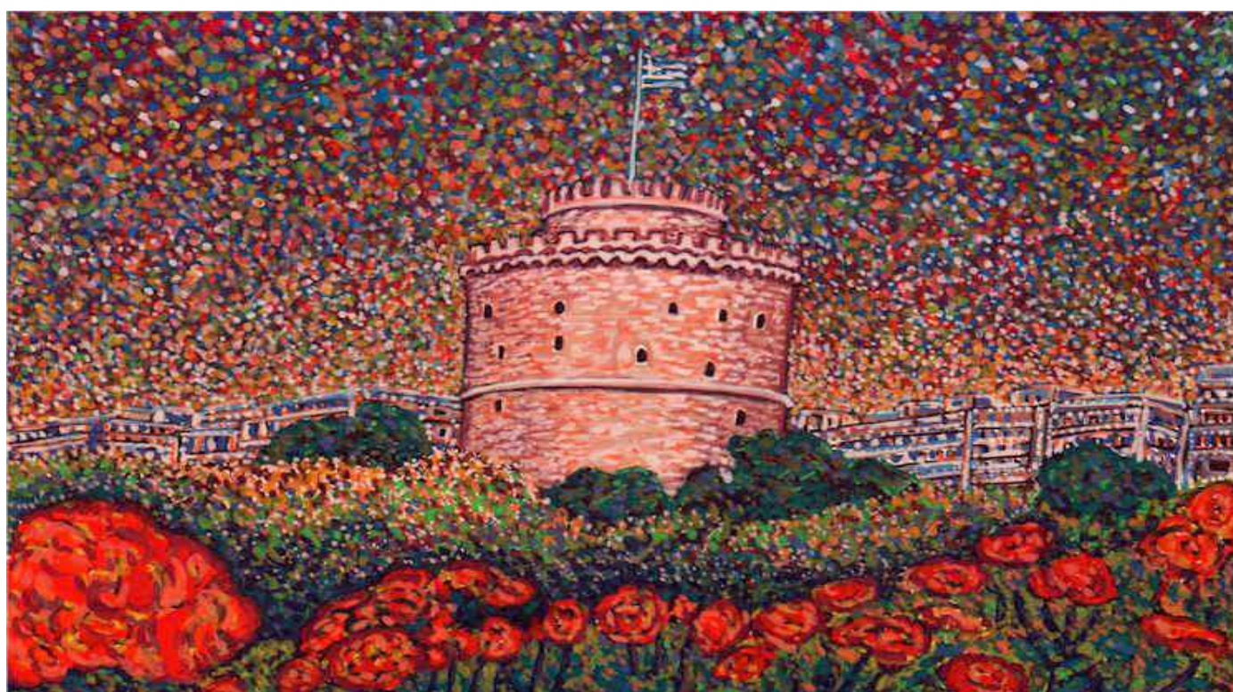
Ντίνος Παπασπύρου, "Άνοιξη στον Λευκό Πύργο" (Τέμπρα), 2015

ΗΜΕΡΟΜΗΝΙΑ ΔΙΑΓΩΝΙΣΜΟΥ 27 ΦΕΒΡΟΥΑΡΙΟΥ 2016 ΗΜΕΡΟΜΗΝΙΑ ΤΕΛΕΤΗΣ ΒΡΑΒΕΥΣΗΣ 4 ΑΠΡΙΛΙΟΥ 2016