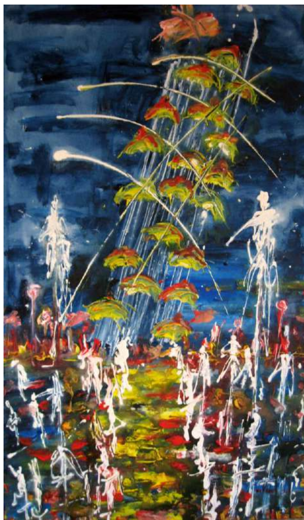
Τάσσα Μπιτσάνη, Ερωτική Θεσσαλονίκη, 2015

Μολυσμένη η ζωή, η δουλειά και η ιδέα, Πάνω απ' το στρώμα στέκει ο πόθος. Ο χτύπος αλλάζει, το τζάμι θα σπάσει, Το λουλούδι δεν φοβάται πως θα μαραθεί.