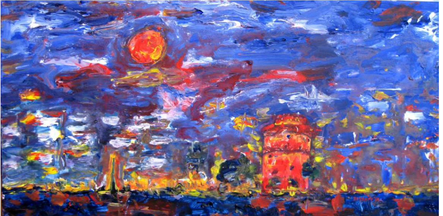
Τάσσα Μπιτσάνη, Τις Μαγικές σου Νύχτες Νοσταλγώ... , 2015