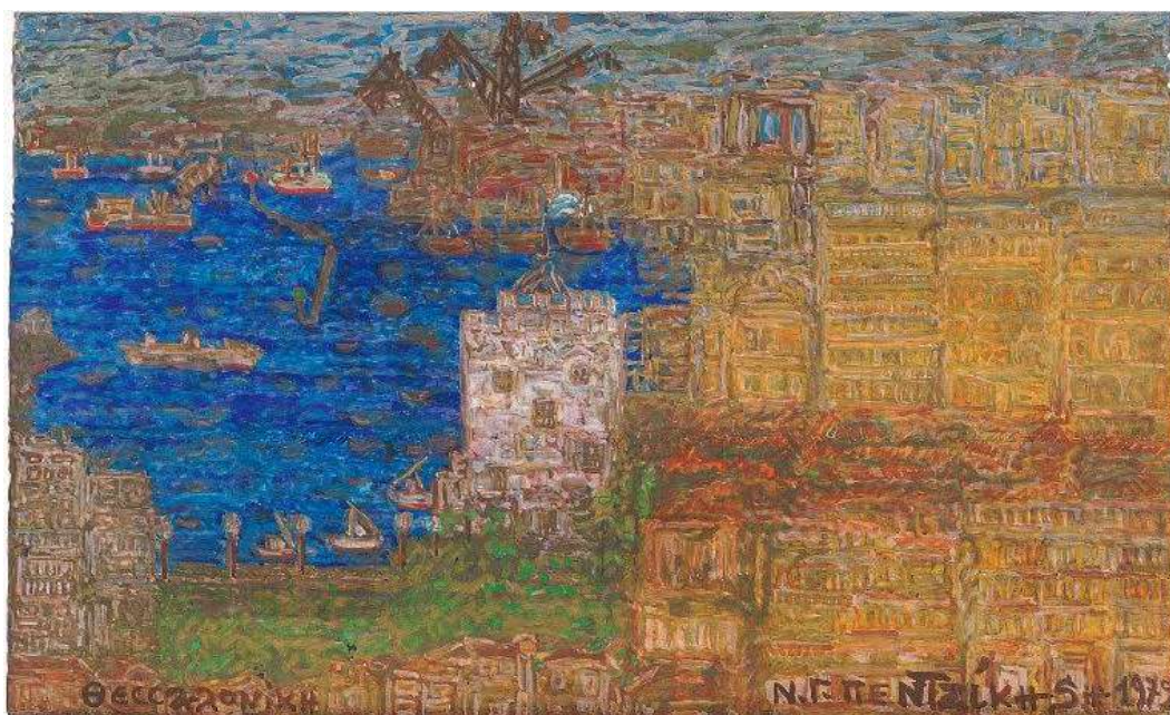
Νίκος-Γαβριήλ Πεντζίκης, Λευκός Πύργος, 1972