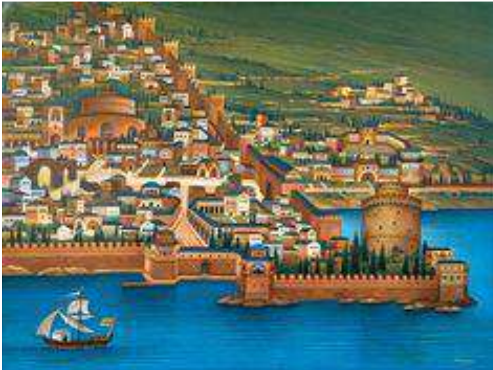
Θανάσης Μπακογιώργος, Βυζαντινή Θεσσαλονίκη, 1997

Πώς γίνεται αγάπες όπως αυτή να τελειώνουν;