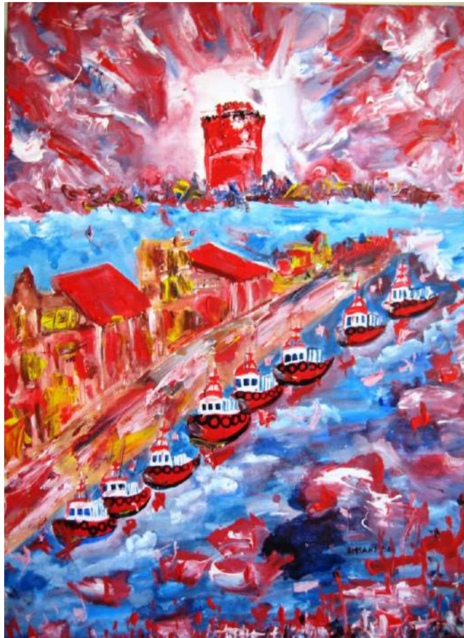
Τάσσα Μπιτσάνη, Χαρούμενες Υπάρξεις, 2016