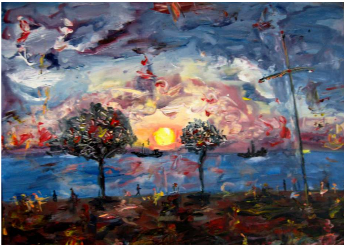
Τάσσα Μπιτσάνη, Ηλιοβασίλεμα που μας ζεσταίνει την καρδιά, 2015