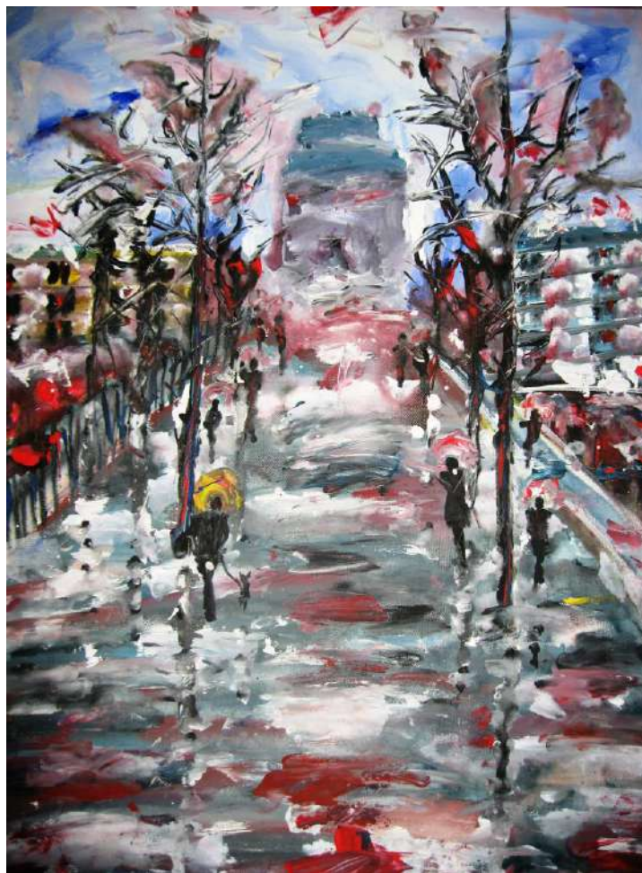
Τάσσα Μπιτσάνη, Ονειρική Θεσσαλονίκη, 2012

Ένα χάδι, μια αγκαλιά, αυτό χρειαζόταν μονάχα. Έτσι λοιπόν έφυγε ο σκυλάκος, κάτω από τον καταγάλανο ουρανό της Θεσσαλονίκης, δίπλα στον Λευκό Πύργο, ανάμεσα σε τόσο κόσμο. Βλέπετε λίγη αγάπη είναι αρκετή και ικανή να εξαγνίσει τις αθώες ψυχές. Μονάχα λίγη αγάπη.